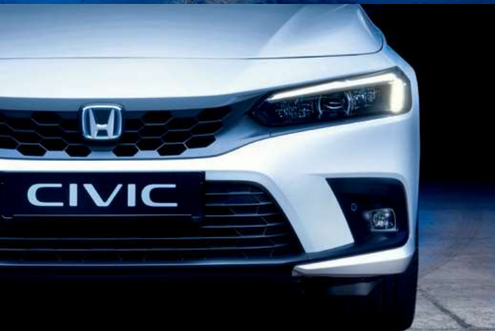
Nová Honda Civic