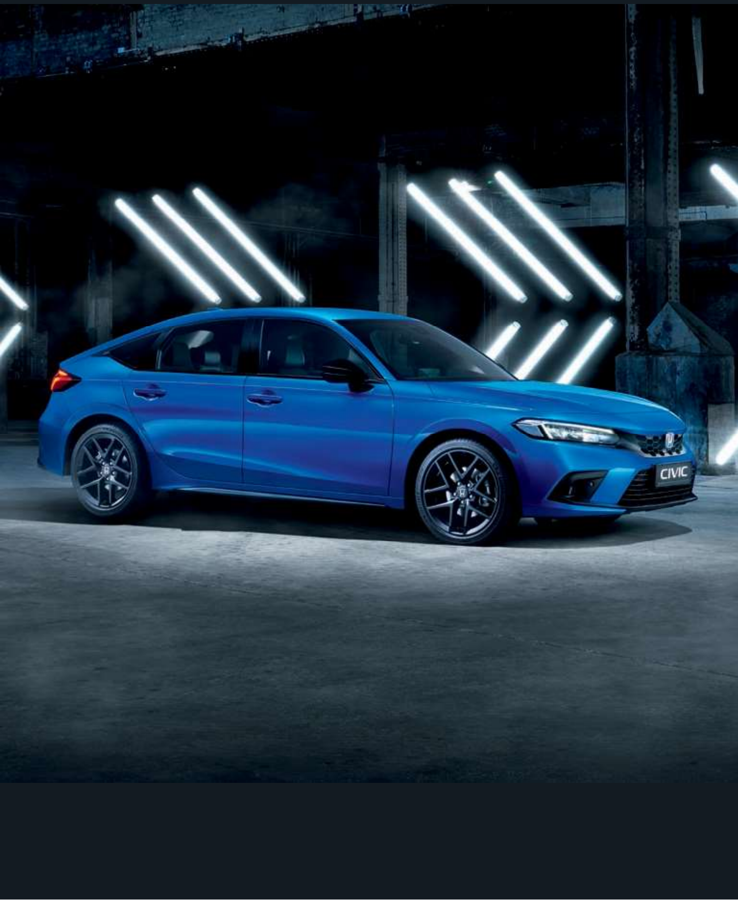
Nová Honda Civic