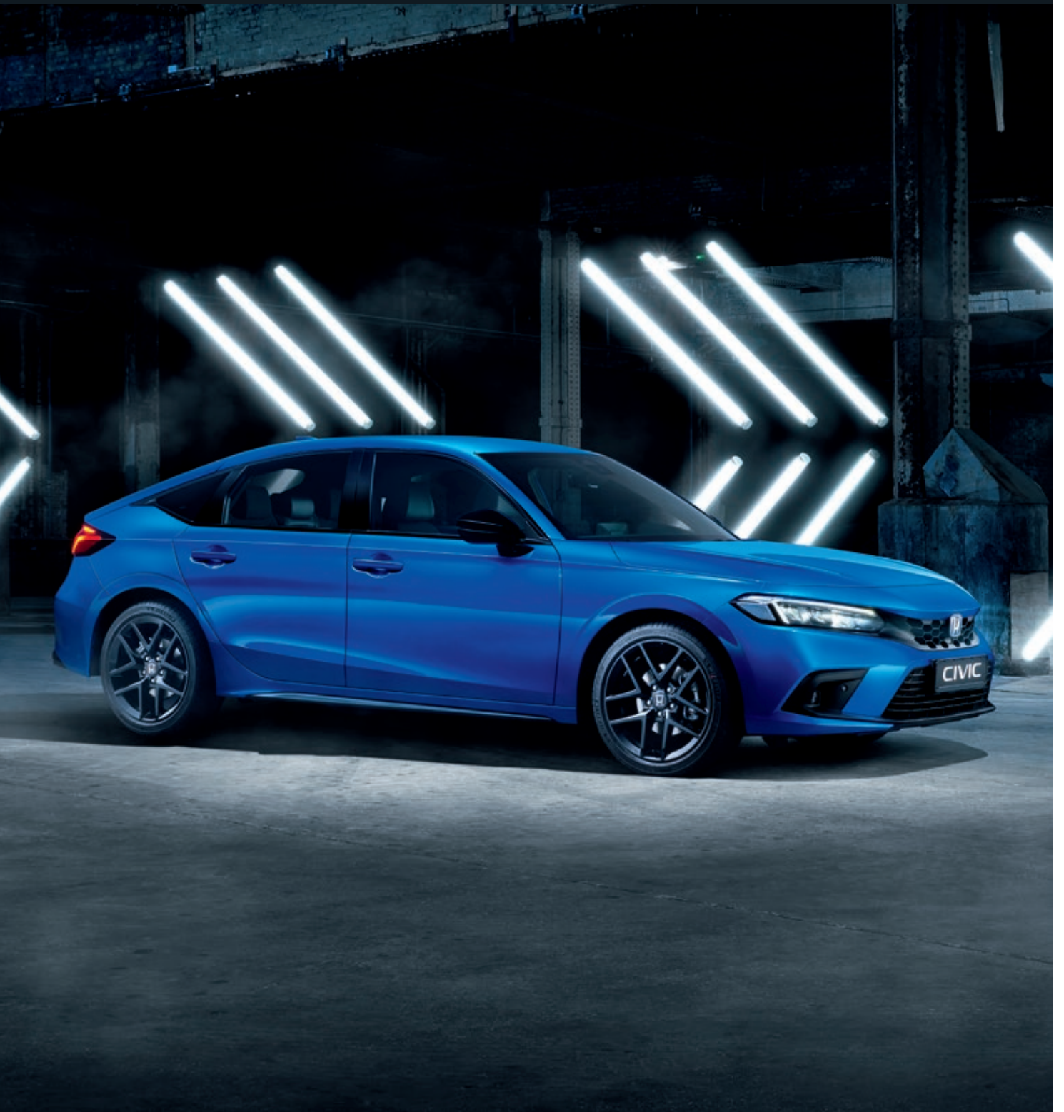
Nová Honda Civic