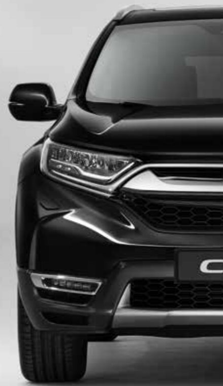
PERLEŤOVÁ CRYSTAL BLACK