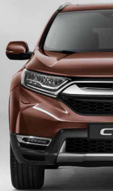
PERLEŤOVÁ PREMIUM AGATE BROWN