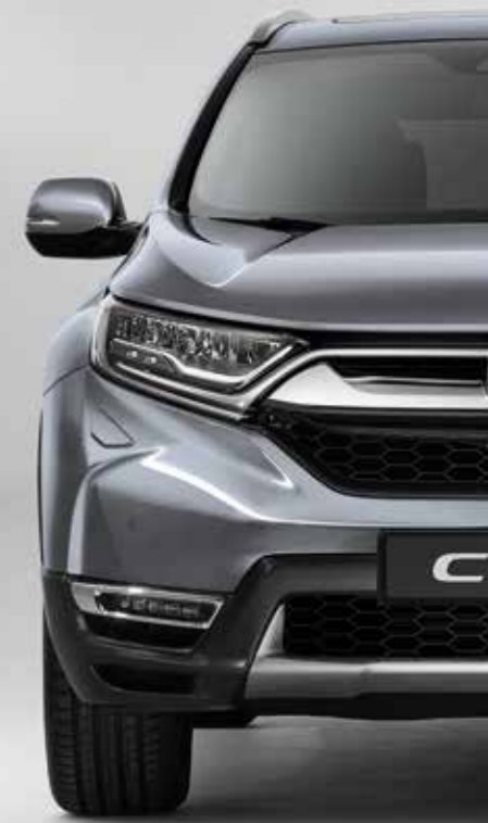
METALICKÁ LUNAR SILVER