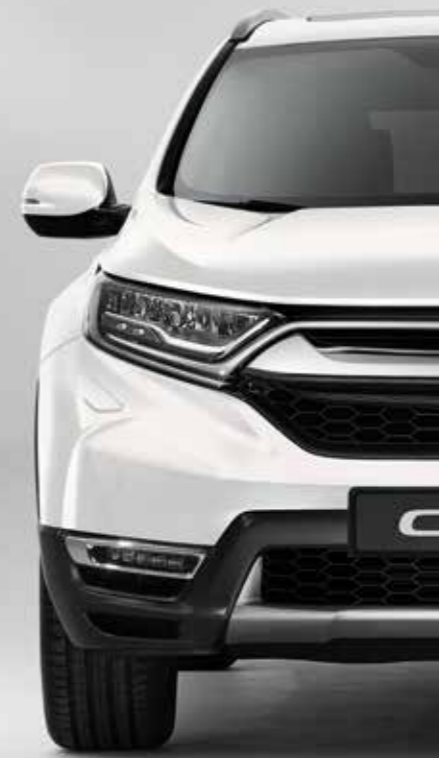
PERLEŤOVÁ PLATINUM WHITE