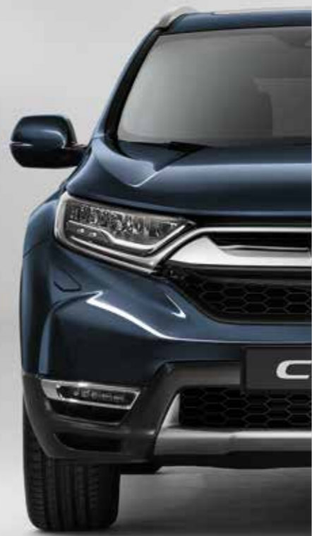
METALICKÁ COSMIC BLUE