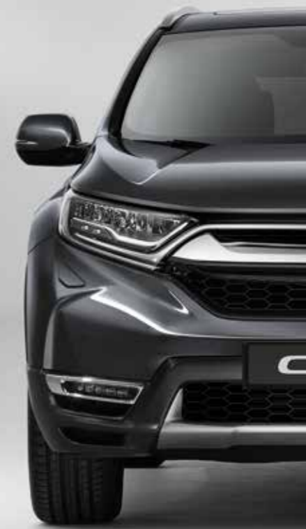
METALICKÁ MODERN STEEL