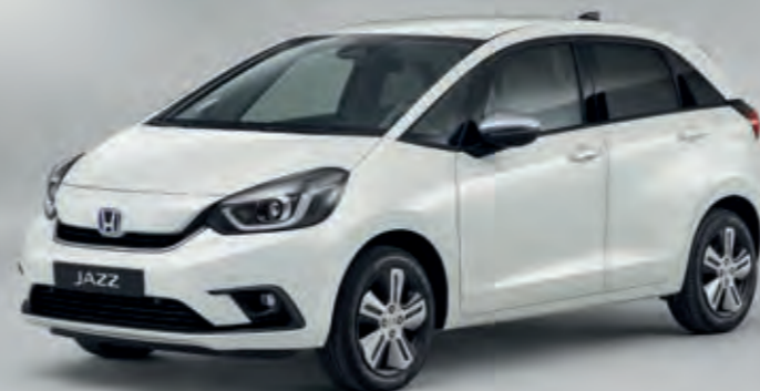
PERLEŤOVÁ PLATINUM WHITE