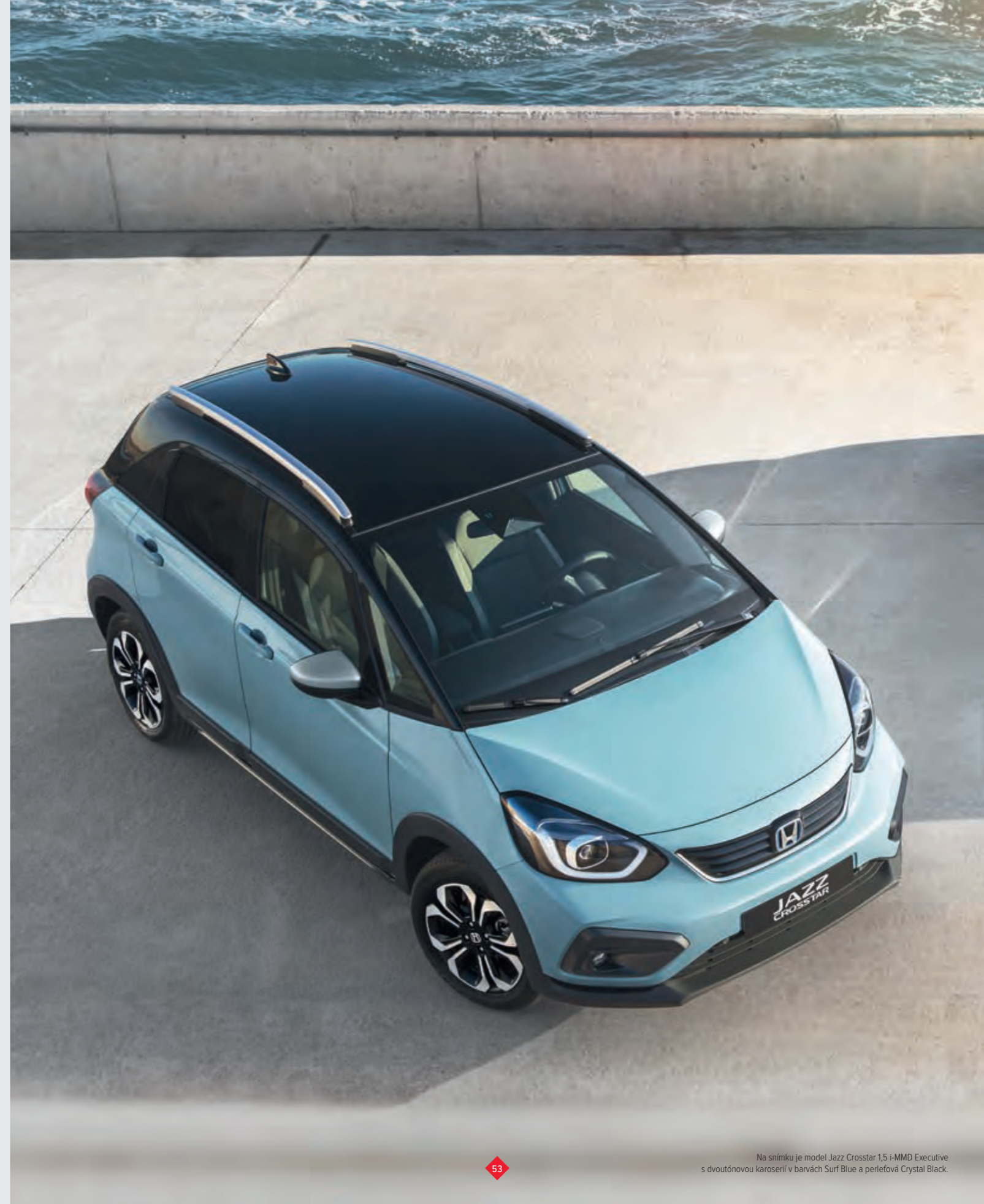
Na snímku je model Jazz Crosstar 1,5 i-MMD Executive s dvoutónovou karoserií v barvách Surf Blue a perletová Crystal Black.

◆ standardní výbava – není v nabídce ◇ volitelné