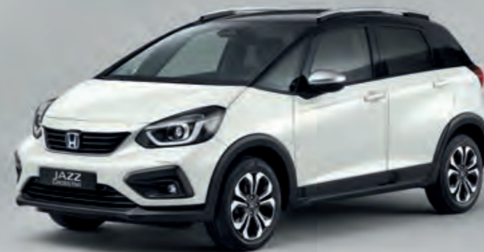
PERLEŤOVÁ PLATINUM WHITE / DVOUTÓNOVÁ VARIANTA